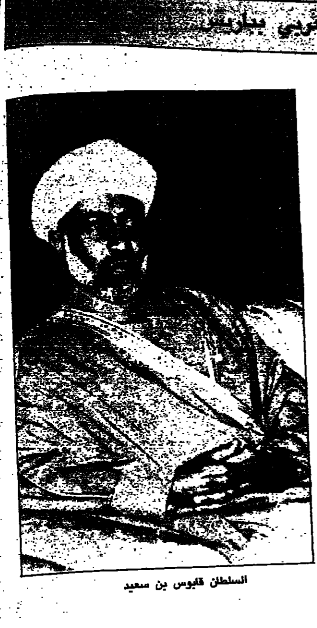
السلطان قابوس بن سعيد

وذكر أن الجائزة تُمنح لأفراد في مجالات مختلفة.